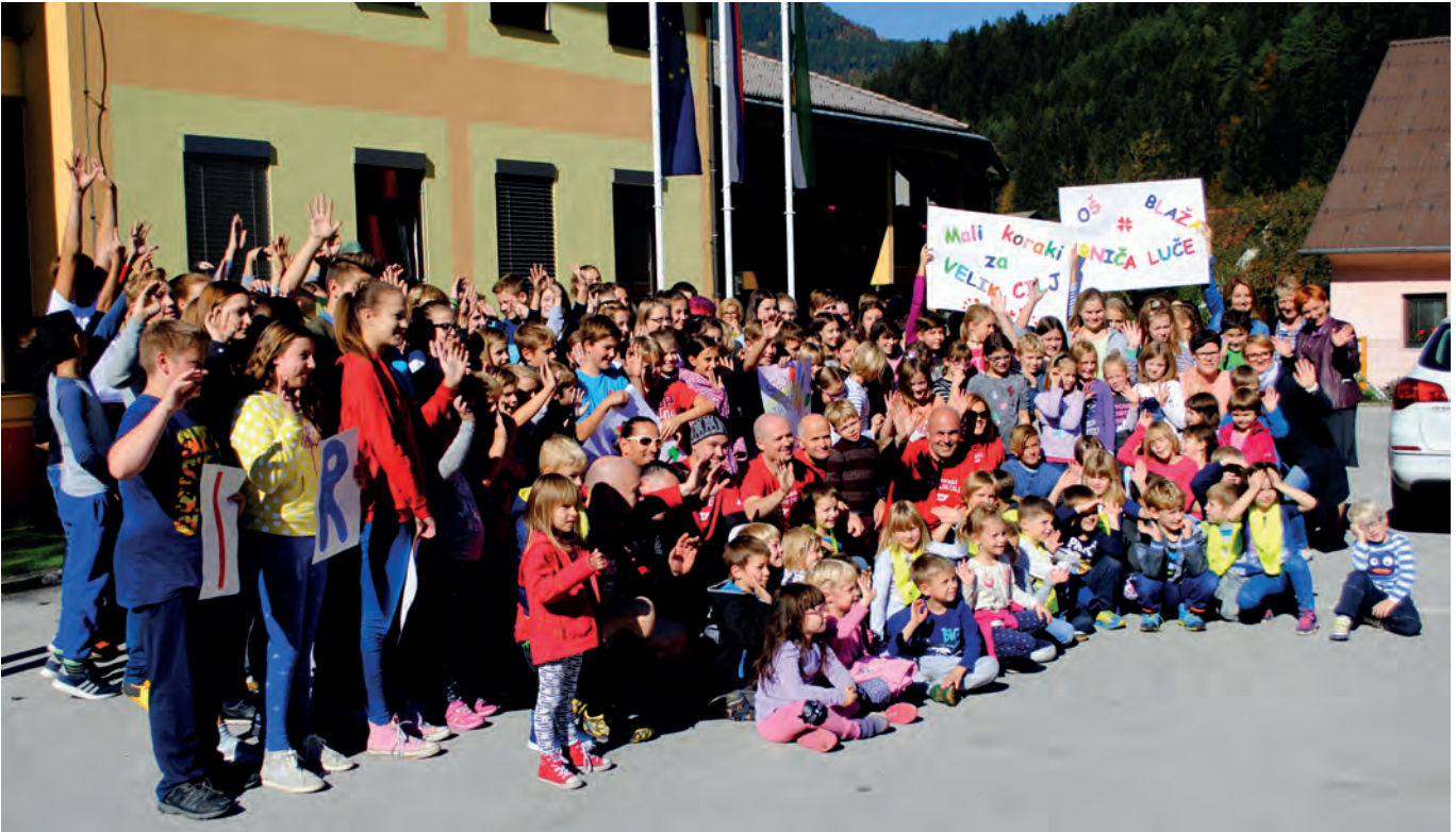
Dobrodelni projekt 'Mali koraki za velik cilj' pomaga socialno ogroženim družinam z otroki

17. novembra smo imeli tradicionalni slovenski zajtrk. Zajtrkovali smo kruh, maslo, med, mleko in jabolka lokalnih pridelovalcev, ob 10.00 pa smo se pridružili vseslovenskemu pevskemu zboru in ubrano zapeli Slakovo pesem Čebelar.