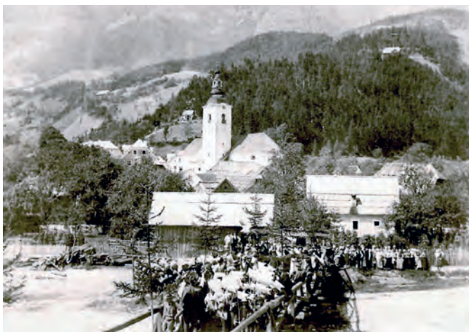
Slovesni sprejem Slovenskega planinskega društva v Lučah

Letos smo slovenski gorniki praznovali petindvajseto obletnico ustanovitve Zveze gorniških klubov SKALA, v katero je vključen tudi Gorniški klub Savinjske doline iz Luč. Skala, ki je bila ustanovljena na Knezovi domačiji v Robanovem kotu, združuje danes dvanajst gorniških klubov po vsej Sloveniji. Nastala je po osamosvojitvi Slovenije zato, da bi nadaljevali tradicijo predvojnih skalašev ter ohranili njihove ideje in njihovo prizadevanje za visoka moralna načela.