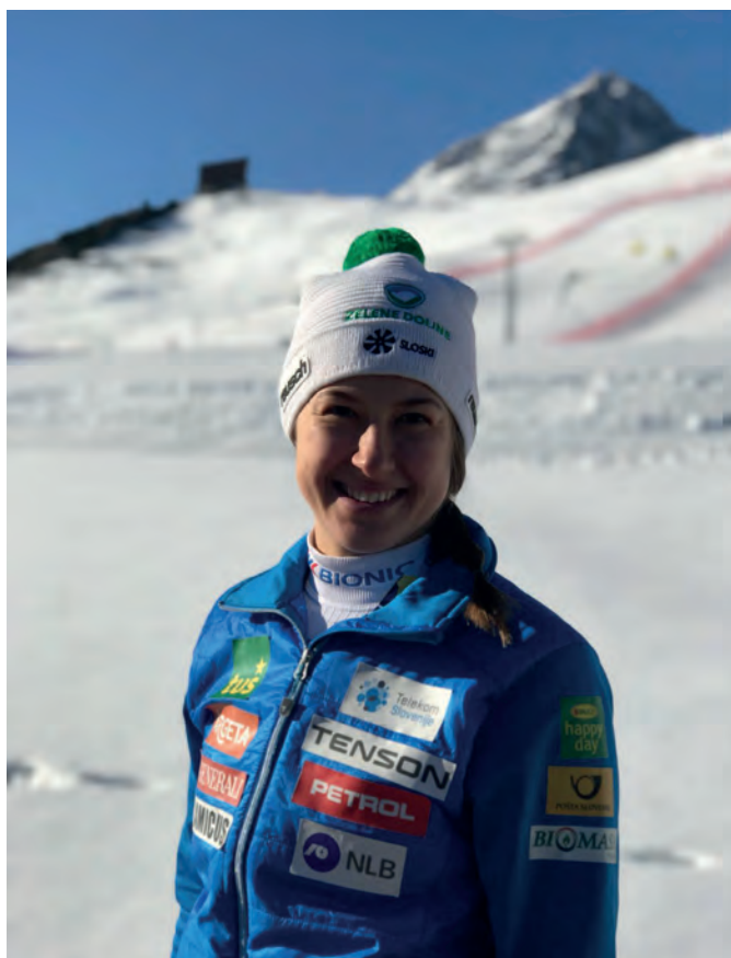
Tina bo slovenske barve zastopala tudi na zimskih olimpijskih igrah v Južni Koreji

Čeprav sem si huje poškodovala hrbet, nisem niti enkrat niti za hip pomislila, da bi s smučanjem zaključila. V bolnici v Švici sem že naslednji dan spraševala zdravnike, kdaj bom lahko spet smučala. Kar malo čudno so me gledali. Skozi rehabilitacijo me je vodila močna volja in verjamem, da mi je to pomagalo pri uspešnejšem okrevanju. Do zgoraj omenjenih pomislekov pa je prišlo kasneje, štiri leta po tej poškodbi.