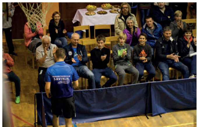
Podpora gledalcev je zelo pomembna