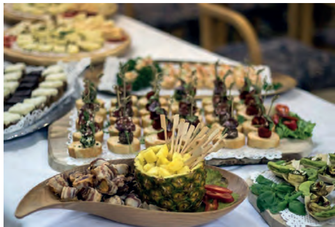
Po proslavi je sledil zabavno-družabni del s pogostitvijo

Štirideset let je minilo od ustanovitve in v tem času se je v okviru delovanja društva zvrstilo že ogromno tekmovanj in drugih športnih dogodkov, udarniških akcij in infrastrukturnih pridobitev, ob tem pa spletlo tudi neskončno število trdnih prijateljev in nepozabnih spominov.