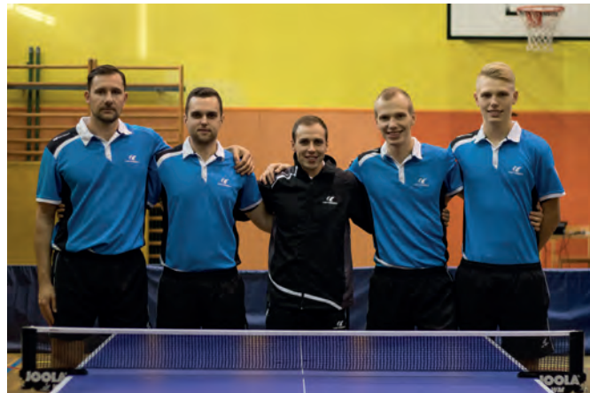
Članska ekipa NTK Savinja je ena izmed desetih najboljših slovenskih ekip

V prvem krogu so (7. oktobra 2017) Lučani v šolski telovadnici gostili ekipo NTK Inter Diskont z Raven na Koroškem.