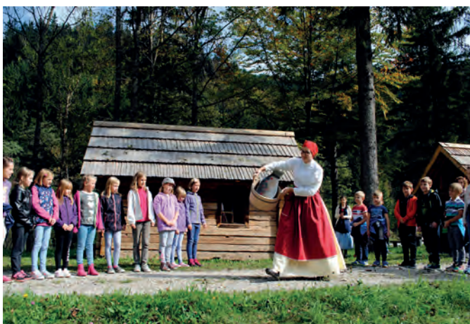
Zaključna prireditev projekta 'Dediščina gre v šole'

1. septembra je šolski prag prestopilo 180 učencev, od tega 14 novincev, vrtec pa obiskuje v Lučah 53 otrok, v Solčavi pa 18 otrok. Naš vsakdan oblikuje vzgojno-izobraževalno delo, ki ga od nas zahteva Letni delovni načrt. Da pa so dnevi bolj pestri, tudi letos sodelujemo v različnih obšolskih dejavnostih (tekmovanja, projekti, prireditve, šole v naravi ...).