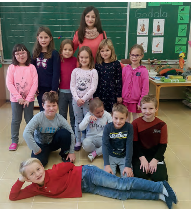
Učenci 8. in 9. razreda so se preizkusili v poučevanju

Ta dan je tudi dan slovenske hrane, zato smo pregovorili o njej – starejši otroci so si ogledali film Ne mečmo hrane stran, za starše pa je bil organiziran roditeljski sestanek na to temo. Izvedeli smo skoraj neverjeten podatek – tretjino hrane vržemo v smeti. POTRUDIMO SE, DA ZMANJŠAMO TO ŠTEVILKO!