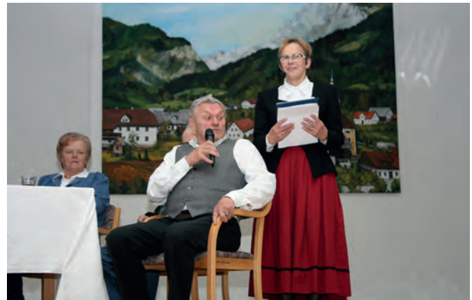
Francl se je spomnil številnih prigod iz snemalnih dni

Ni bilo lahko, ni bilo veliko, bilo je težje od pričakovanj po toliko letih uresničiti že davno zamisel in najti sogovornike, ker mnogih ni bilo več med živimi. Veseli smo, da smo s prireditvijo »ujeli« letošnji okrogli jubilej. Zelo smo bili veseli izjemnega obiska na prireditvi, da ste napolnili domačo dvorano kot že dolgo ne, prisluhnili priložnostnemu programu in lahko po 51. letih po snemanju pogledali del filma, posnetega v Lučah (prenekateri šele prvič). Ja, 51 let mlajši smo bili vsi in nekatere je bilo težko prepoznati toliko let mlajše po prireditvi na razstavljenih slikah iz filma, ob katerih so se številni zadržali pred zaključkom večera in izmenjavali še svoje spomine na tiste dni.