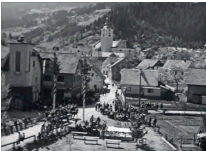
Prizor iz filma Pitchi Poi

V tem prispevku se bom dotaknila spominov, starih več kot 50 let. Navezujejo se na dve lepi letošnji obletnici, na kateri smo Lučani obujali spomine s priložnostnim programom na veliki javni prireditvi v domači kulturni dvorani v maju. Ena od obeh omenjenih obletnic pa se je zgodila nedolgo nazaj – v začetku novembra je minilo 50 let od prvega predvajanja filma »PITCHI POI« pri nas.