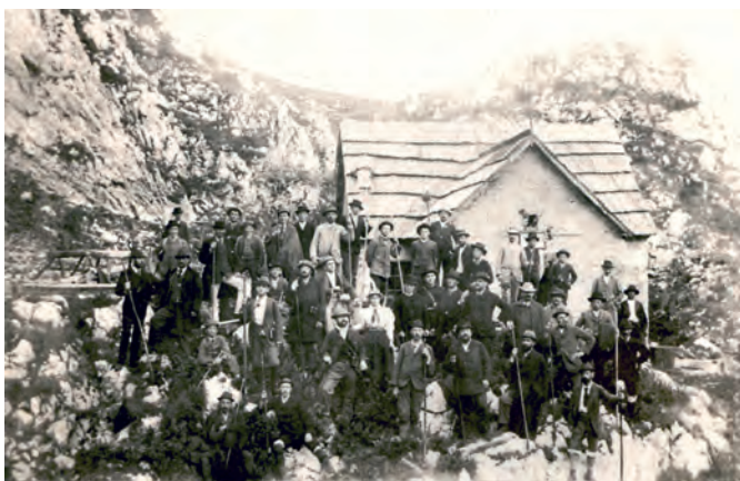
Odprtje Kocbekove kočice na Molički planini 16. avgusta 1894

Skalaši so 2. februarja 1921 ustanovili Turistovski klub Skala kot alternativo Slovenskemu planinskemu društvu (SPD). Zagovarjali so idejo elite, vendar ne v smislu