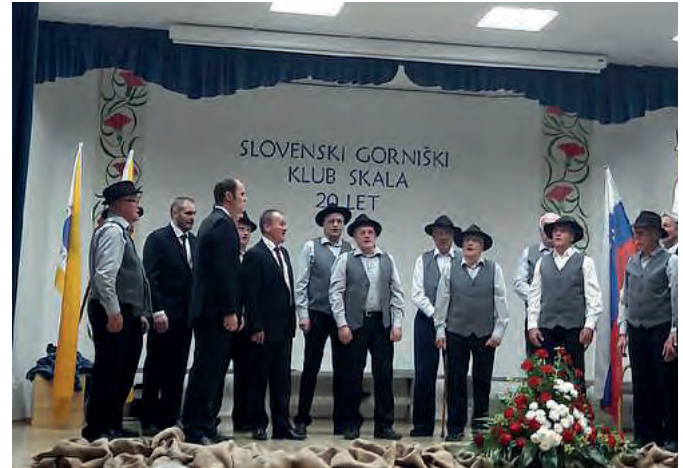
Ljudski pevci iz Luč so prejeli najvišjo gorniško nagrado – Kocbekovo priznanje