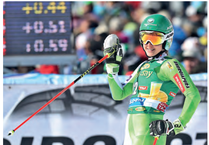
Po sezoni 2014/15 je razmišljala celo o zaključku kariere