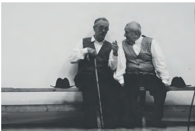
Na snemanju jubilejne oddaje Slovenska zemlja v pesmi in besedi v domači kulturni dvorani