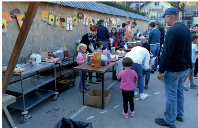
Tetka Jesen je poskrbela za razne jesenske dobrrote

Jesen je tudi letos prinesla v vrtec pisane barve in številne jesenske dobrrote. Otroke iz vrtca in njihove babice in dedke je tetka Jesen obiskala pri vlcerski bajti, polne koše jesenskih dobrot pa je nasula na igrišču.