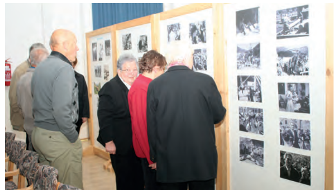
Obiskovalci so po prireditvi z zanimanjem iskali znane obraze na razstavljenih fotografijah