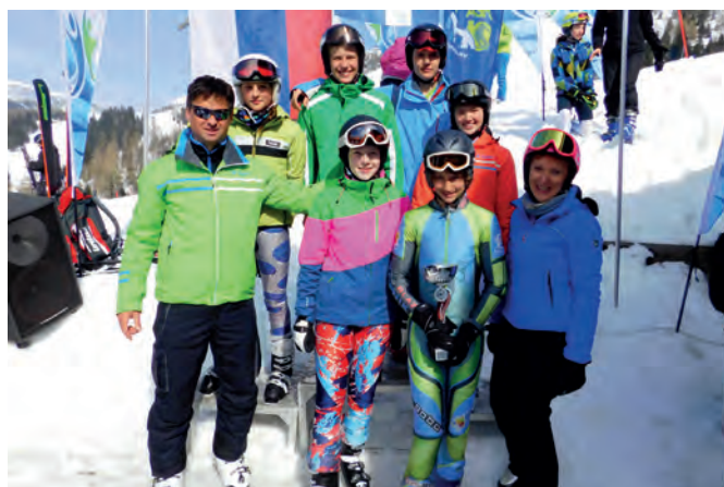
Osnovnošolci so dosegli odlične rezultate na različnih športnih področjih

v smučanju, na državnih tekmovanjih pa so tekmovali tudi v namiznem tenisu, krosu ter mlajše deklice v košarki.