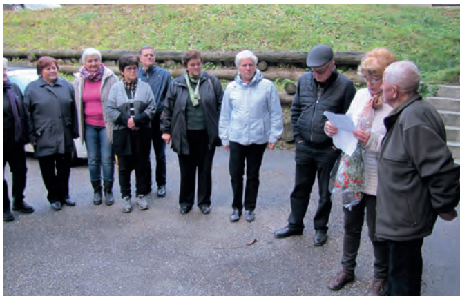
Na praznovanju so ga presenetili številni prijatelji in predstavniki društev, v katerih je sodeloval

Aktiven je bil v preteklosti tudi v Krajevni organizaciji RK Luče, v upravnem odboru, pri organizaciji različnih pomoči s posebnim čutom do socialnih problemov ljudi in v krvodajalskih akcijah. Še vedno je podporni član društva. Okrog 38-krat je daroval kri in za sodelovanje pri krvodajalskih akcijah prejel 1975 diplomu RO RK Slovenije.