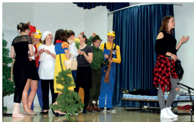
Uprizoritev Rdeče kapice malo drugače

Oktober je potekala akcija televizijske hiše POP TV in KANAL-a A Mali koraki za velik cilj. Tekači so tekli od slapu Rinka do Celja. Postanek so naredili tudi pred našo šolo. Srečanje z njimi nam je ostalo v prijetnem spominu.