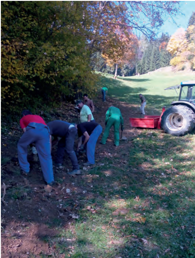
Opravljenih je bilo več delovnih akcij

Koča na Loki je dolga leta elektrificirana s fotovoltaičnim sistemom, predvidoma s pričetkom prihodnje planinske sezone koč pa naj bi bila vključena v električno omrežje. Občinski svet Občine Luče je za leto 2017 v proračunu za elektrifikacijo Koče na Loki namenil sredstva v višini 25.000 €.