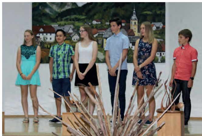
Najuspešnejši devetošolci generacije 2016/17

Tretji del praznovanja pa je bil namenjen posameznikom in skupinam iz Luč, ki so s svojim delom veliko doprinesli k razvoju in ugledu domačega kraja.