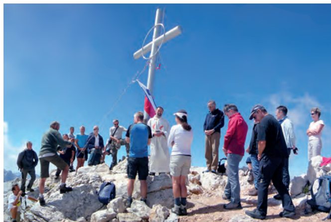
Blagoslov križa na Škrlatici

Skalaši so 2. februarja 1921 ustanovili Turistovski klub Skala kot alternativo Slovenskemu planinskemu društvu (SPD). Zagovarjali so idejo elite, vendar ne v smislu