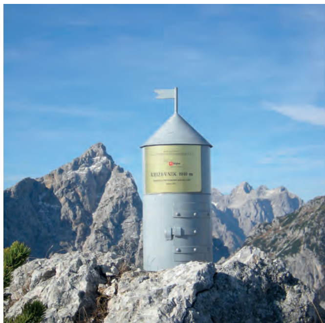
Aljažev stolpič na Križevniku (1909 m)

Njihov idejni in filozofski vodja je bil velik domoljub in izjemen izobraženec tistega časa dr. Henrik Tuma. V naših gorah so splezali najtežje smeri in slovenski