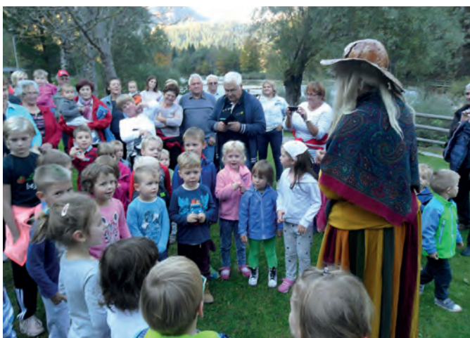
Tetka Jesen na obisku pri Vlcerski bajti