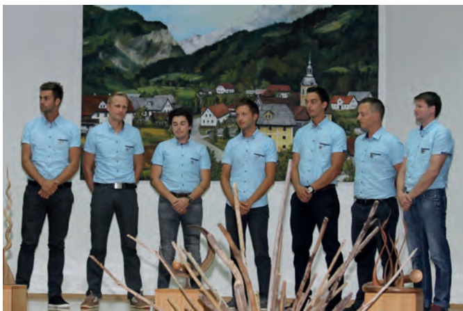
Športno društvo Raduha je v letu 2017 praznovalo 40-letnico uspešnega delovanja

Športno društvo Raduha Luče je bilo ustanovljeno 9. 12. 1977. Tako letos praznuje že 40-letnico uspešnega delovanja. Takratni ustanovni člani društva so bili po večini vsi v delovnem razmerju v osnovni šoli.