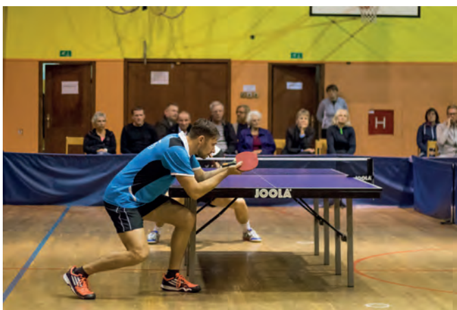
V domači telovadnici lahko spremljate vrhunške tekme

V prvi namiznoteniški ligi (1. SNTL) nastopa deset najboljših slovenskih ekip. Prvenstvo je razdeljeno na jesenski in spomladanski del. Z vsako ekipo se tako odigrata dve tekmi: ena doma in ena v gosteh. Tekme se praviloma igrajo ob sobotah ob 17. uri. Enako kot v ostalih ligah se tekma igra tako dolgo, dokler prva ekipa ne doseže pet posamičnih zmag. Vsaka ekipa je sestavljena iz treh igralcev in do dveh možnih rezerv.