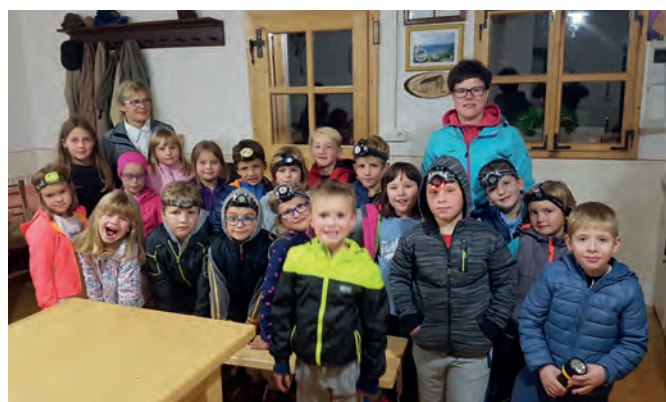
Nočni obisk Vlcerske bajte