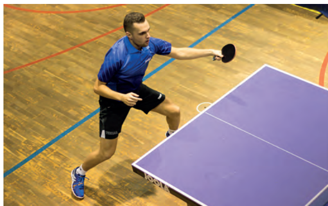
Lučani so zadovoljni z izkupičkom jesenskega dela

Tudi v drugem delu sezone igralci novopečenega prvoligaša iz Luč obljublajo borbo za vsako žogico. Gledalci pa ste vabljeni, da še naprej prihajate na domače tekme v čim večjem številu, spremljate vrhunski namizni tenis in z navijanjem pomagajte domačinom, da dosežejo še marsikatero prvoligaško zmago.