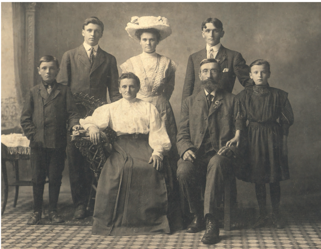
Jerijeva družina v Ameriki

hudo ranjen v nogo in nato evakuiran v ZDA. Po končani prvi svetovni vojni je bil eden od ustanoviteljev ameriške invalidske veteranske organizacije (DAV) in v letih 1947 in 1948 tudi njen predsednik.