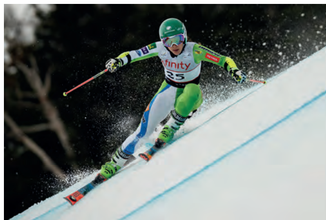
Menjava opreme je lahko zahtevna sprememba

Že prejšnjo zimo sem na določenih delih prog smučala na ravni kot smučam sedaj, vendar pa tega v različnih razmerah in konfiguracijah prog nisem uspela prikazati. Postala sem bolj stabilna in zanesljiva, v mojem smučanju ni več toliko nihanj in res lahko rečem, da smučam bolje kot lani. Napredek sem naredila v tehniki smučanja ter v fizični in psihični pripravljenosti.