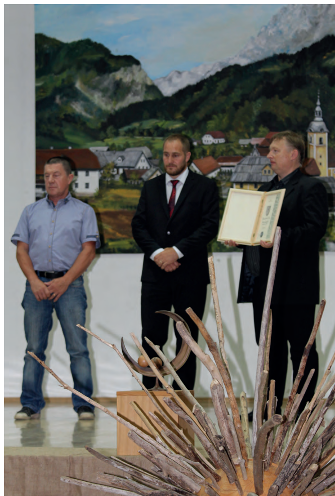
Smučarsko-tekaško društvo in Smučarski klub Luče opravljata izjemno delo na lučkem smučišču

Smučarsko-tekaško društvo trenutno šteje 16 članov, ki tudi z lastnimi sredstvi prispevajo k zglednemu delovanju smučarske dejavnosti v vsej svoji širini in omogočajo, da se mladi rod lahko nauči smučati na domačem smučišču. Poleg tega pa celotno zimsko sezono izvajajo zasneževanje, ko jim to dovoljujejo prave nizke temperature. Redno obnavljajo licence, izvajajo treninge in tekme.