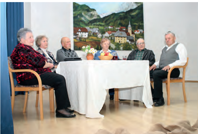
Sogovorniki, ki so z obiskovalci v dvorani delili svoje spomine na snemanje filma

Potem so stekle priprave. Združili smo moči upokojenci in občina. Sprejela sem velik izziv, izbrali smo ekipo sodelavcev in se odločili za »Večer spominov na snemanje filma v Lučah« v maju. Vmes sem veliko spraševala med ljudmi o spominih.