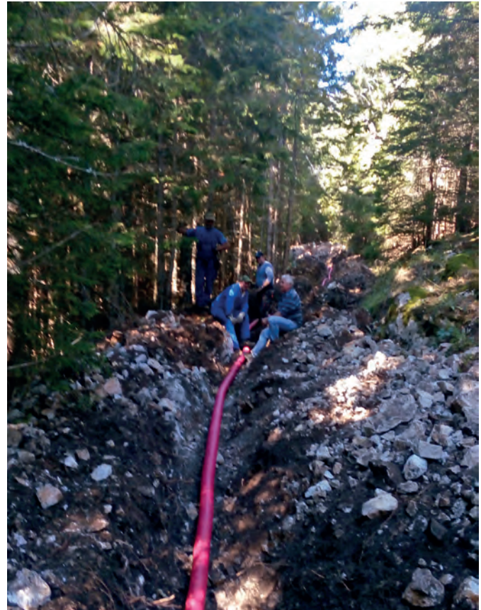
Zgodnja zima je preprečila dokončno izvedbo del

Pri načrtovanju del je bilo ugotovljeno, da je optimalna trasa napeljave kabla od koč čez čez Cirkonco do Radušnika, kajti tam je bilo najmanj posega v gozd, ker je na tej lokaciji že