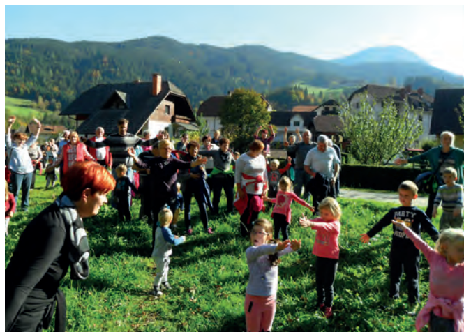
V projektu Simbioza giba so sodelovali tudi najmlajši iz vrtca skupaj svojimi babicami in dedki

Na tekmovanjih iz znanja slovenščine, angleščine, nemščine, zgodovine, matematike, logike, kemije, biologije, kemije, fizike in vesele šole so učenci dosegli 208 bronastih, 21 srebrnih in 2 zlati priznanji. Dosegli pa so tudi veliko odličnih rezultatov na športnih tekmovanjih; veliko pokalov in medalj so učenci osvojili na medobčinskih, področnih ter na četrt- in polfinalnih državnih tekmovanjih, drugo leto zapored so bili naši učenci ekipni državni prvaki